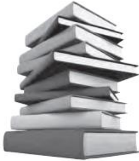
books / pens