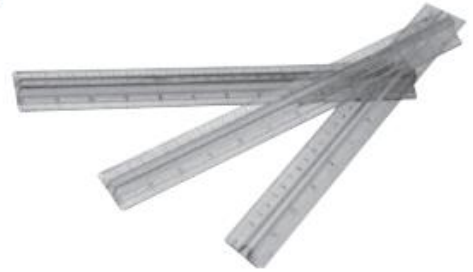
rubbers / rulers