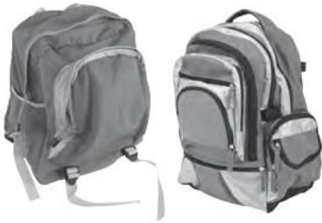
pencil cases / school bags