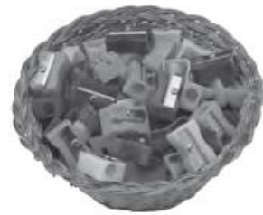
pencils / sharpeners

III- Look and write the sentence (mira y escribe la oración) Observa los ejemplos: