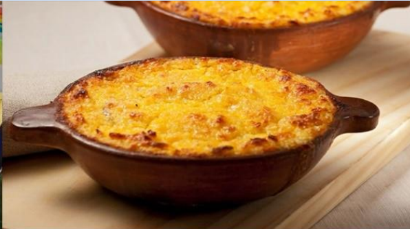
Pastel de Choclos