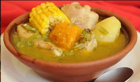
Cazuela de Ave