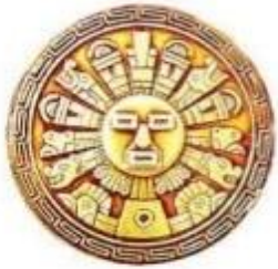
Dador de la vida