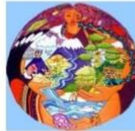
Diosa de la Madre Tierra