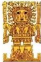
Creador del mundo Inca