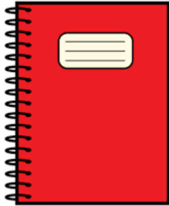
Cuaderno Lengua y Literatura