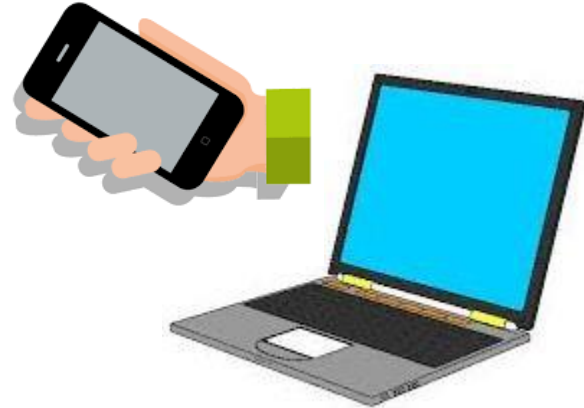
Computador o celular con acceso a internet