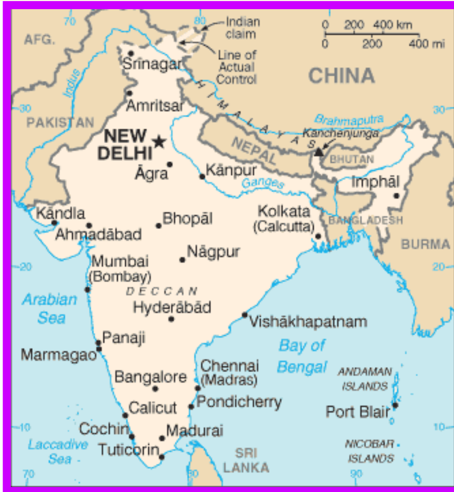
Mapa de la India