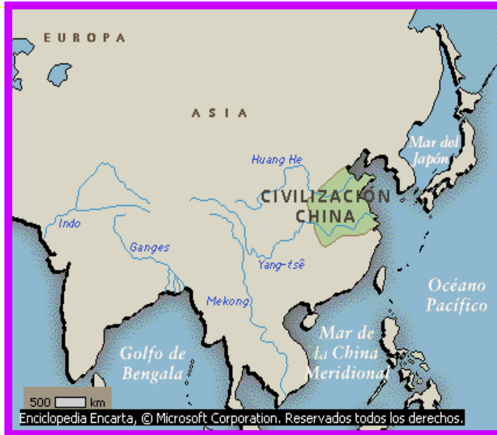
Mapa civilización china