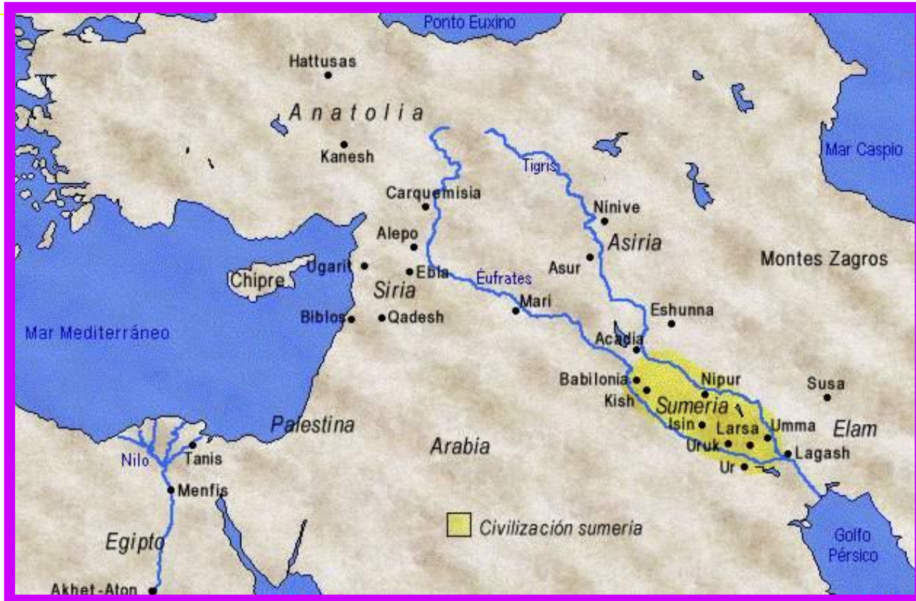
Mapa civilización sumeria