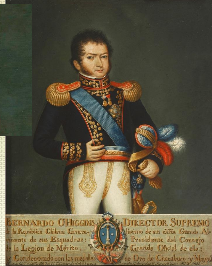
Gil de Castro