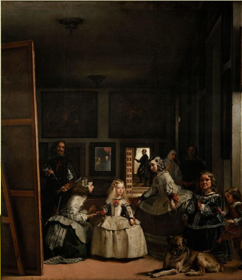
Diego Velázquez: Las meninas . 1656, óleo sobre lienzo, 381 x 276 cm. Museo del Prado, Madrid.