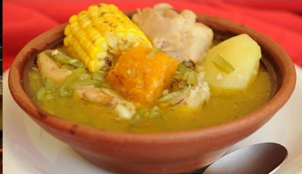
Cazuela de Ave