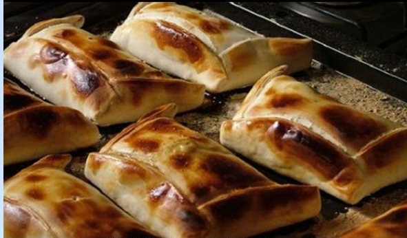
Empanadas de horno