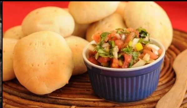
Pan amasado y pebre