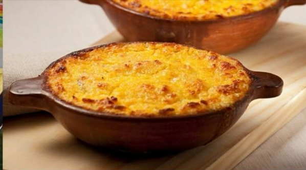
Pastel de Choclos