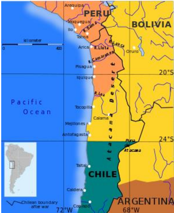
Guerra del Pacífico (1879-1883)