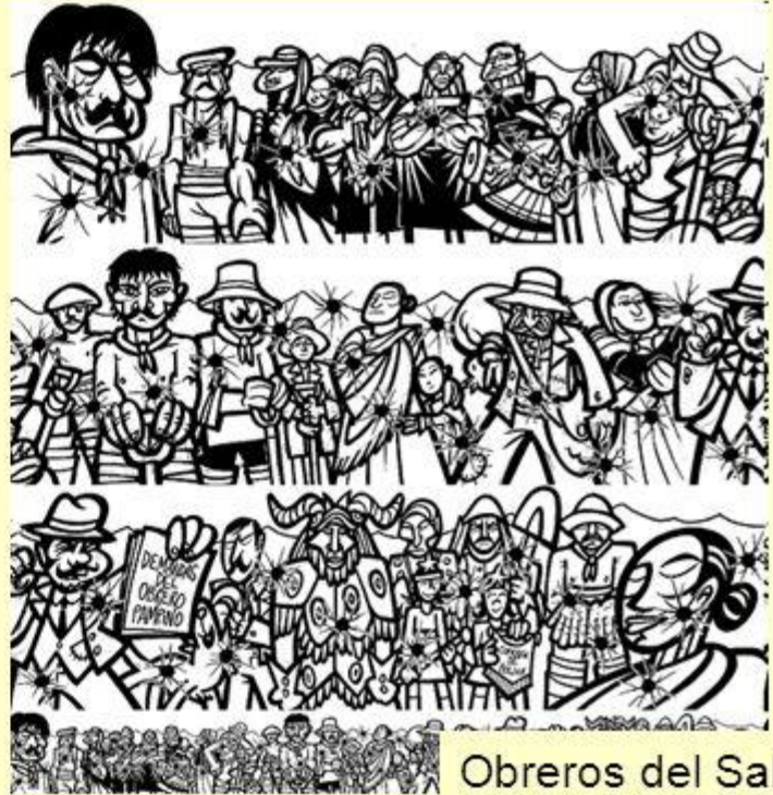
Obreros del Salitre