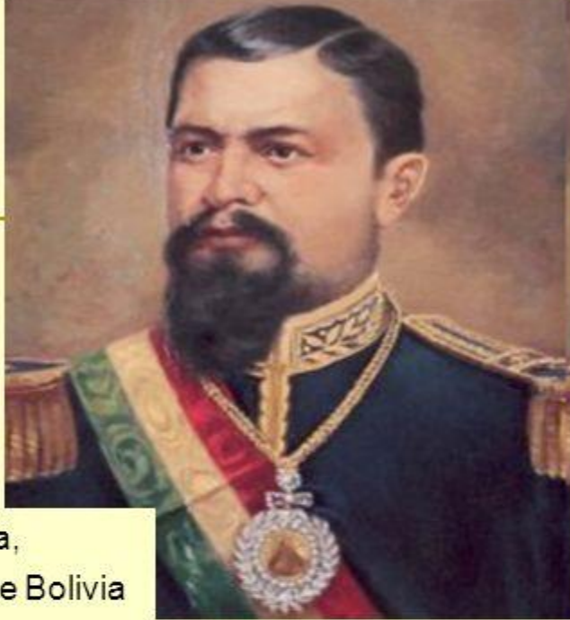
Hilarión Daza, Presidente de Bolivia