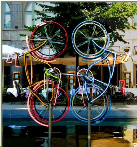
Bicicletas de Robert Rauschenberg

Debe contener al menos tres objetos distintos y 3 colores distintos.