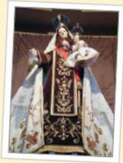
▲ Virgen del Carmen.

*—Claro que sí. La inmensa actividad que trajeron las salitreras de la pampa dio fuerza a esta tradición. Además, en esa época miles de trabajadores de todo el país viajaban hacia el norte buscando trabajos que les dieran más dinero y bienestar. Pero acá no encontraban lo que les prometían; el trabajo era duro y peligroso, la vida en la pampa era severa y a veces cruel. Entonces, los mineros iniciaron una lucha por mejorar sus condiciones de vida y darle dignidad a su trabajo. Eso creó un movimiento social obrero importante, el primero del país. Y el pueblo, al estar unido, buscó otros vínculos que le dieran más sentido a su comunidad. En este caso, la fiesta de La Tirana fue más que una costumbre religiosa propia, única en el mundo. Llegó a ser parte de la vida de las personas.