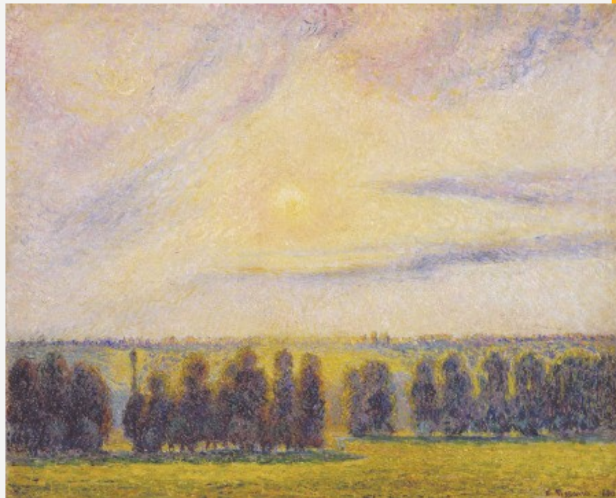
"Puesta de Sol en Éragny" 1890, Camille Pissarro.