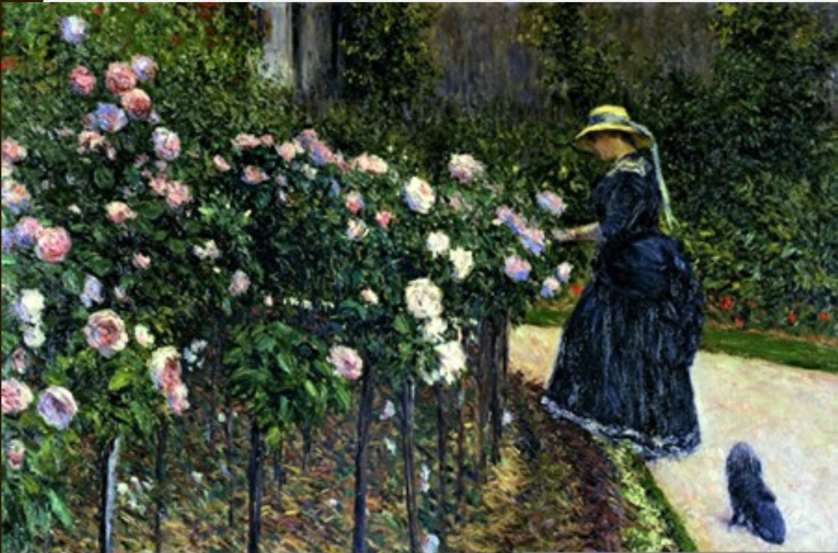
"Las rosas" , 1886. Gustave Caillebotte.

La luz es vital, es la parte fundamental del impresionismo. Es como el color se desarrolla en la naturaleza y en los objetos. Como pasan a través de las hojas de los arboles o como se oscurece cada vez más en el fondo del mar.