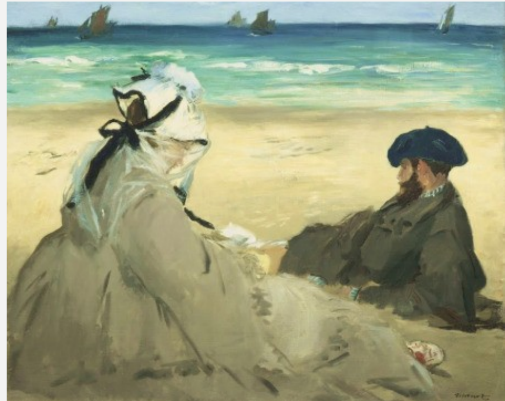
"En la Playa" 1873 por Édouard Manet.