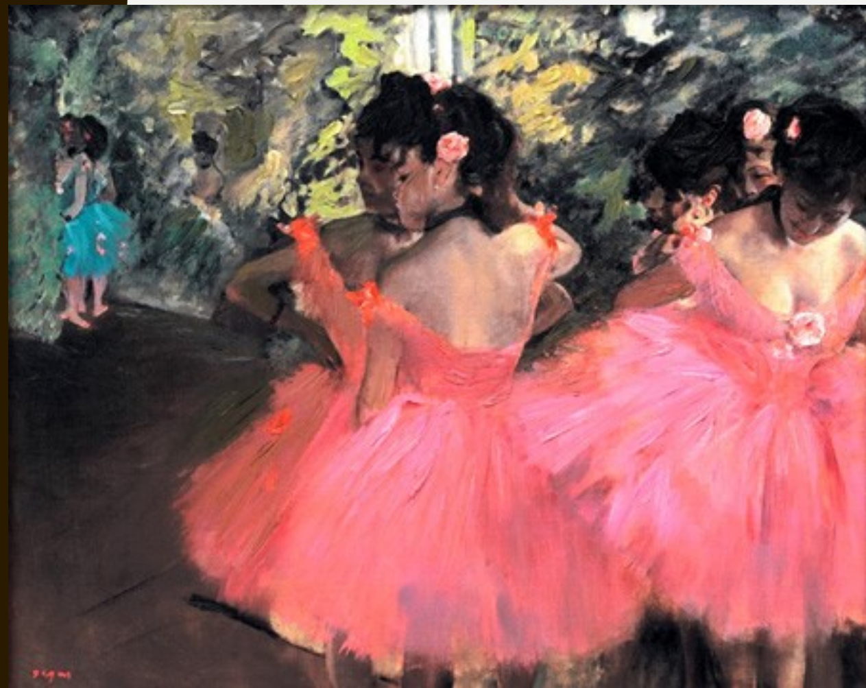
"Bailarinas de rosa" 1883 de Edgar Degas.