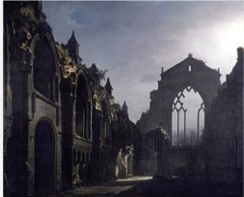
“Ruinas de la capilla de Holyrood a la luz de la luna” (1824), de Louis Daguerre