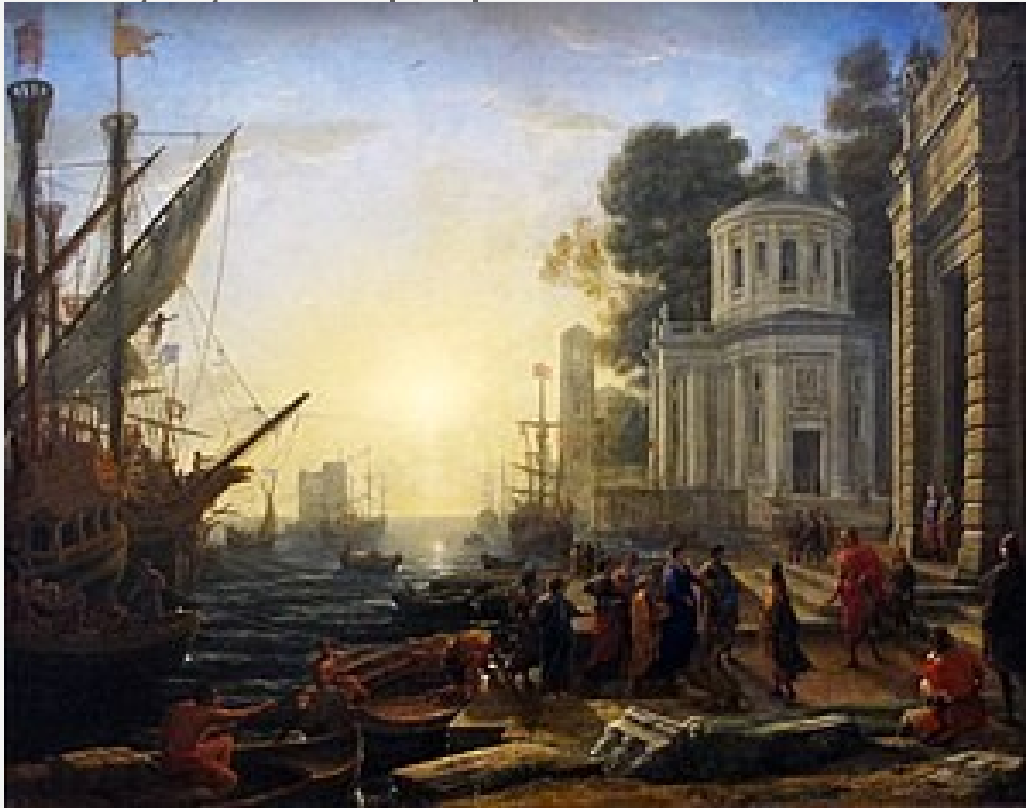
“Puerto con el desembarque de Cleopatra en Tarso”