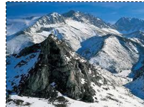
Clima de Alta Montaña