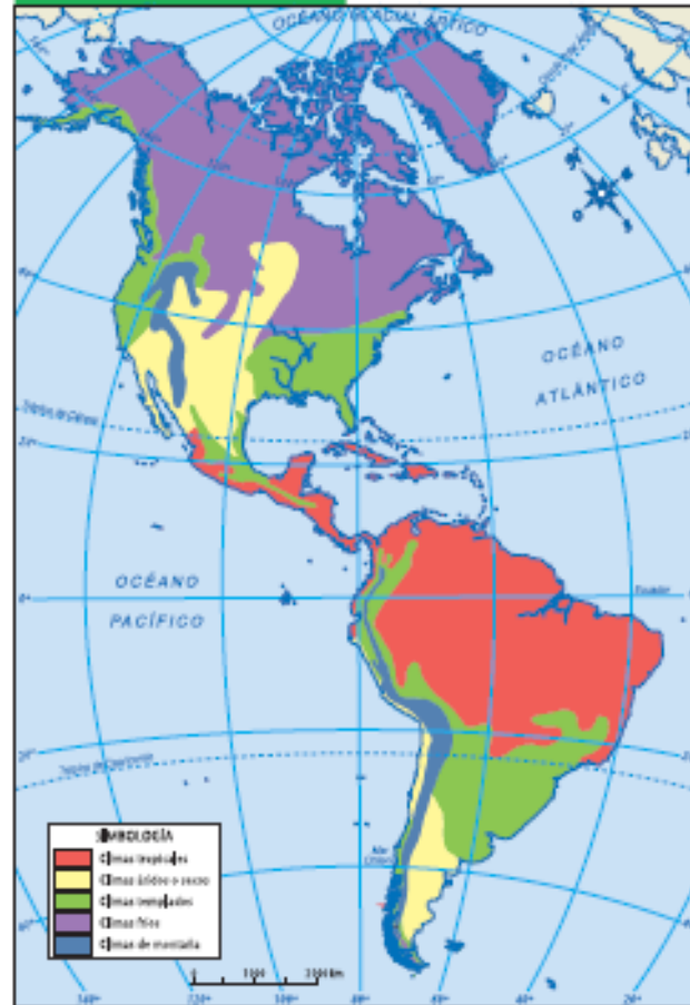
Mapa climático de América

Están presentes en todas las zonas climáticas se caracterizan por sus bajas temperaturas y por presentar precipitaciones en forma de nieve, aunque varían bastante según la altitud.