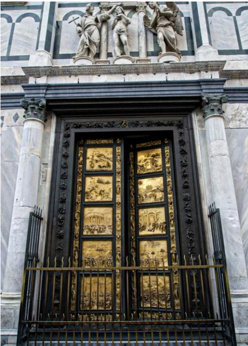
Puertas del Baptisterio de la catedral de Florencia, creadas por Lorenzo Ghiberti. Inauguradas en el 1403.

Los relieves, a diferencia de las esculturas, están integrados en un muro, generalmente, o en caso de ser arte mobiliario, al soporte que los enmarca. Los relieves son muy comunes, particularmente, al exterior de los edificios monumentales, como los templos.