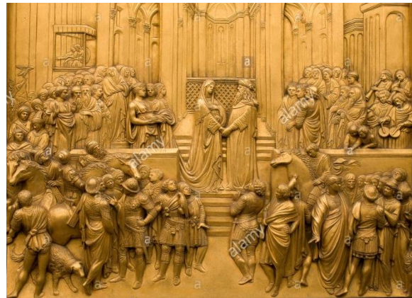
Detalle de las escenas bíblicas que se encuentran en las puertas del Baptisterio.