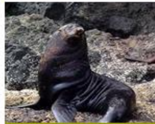
Lobo de Mar