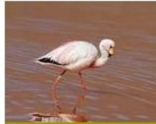
Flamenco de James