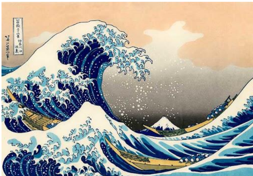
Cuento tradicional japonés

Ya no fue necesaria ninguna otra explicación. Los campesinos y el propio Taro lo entendieron todo. Debido al incendio, todos habían abandonado rápidamente sus obligaciones para acudir a los campos. De no haber sido por eso, las aguas los habrían arrastrado.