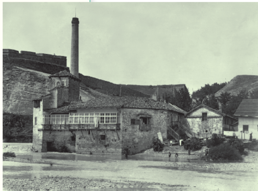
▲ Molino de vapor de principios del siglo XX, ubicado en Pamplona, España.

Se dice que el cultivo del trigo en América fue introducido por la colonización inglesa en las tierras conquistadas. Otras teorías plantean que el trigo entra a América cuando inmigrantes rusos lo trajeron a Kansas, Estados Unidos, en la década de 1870.