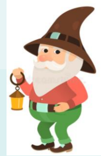
Dwarf is very small