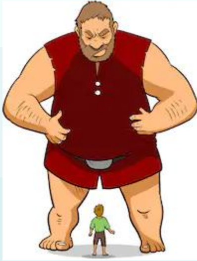
Giant is very big