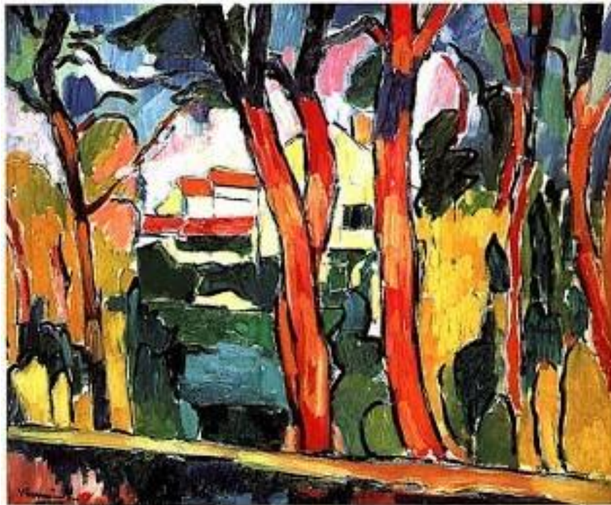
"Paisajes con árboles rojos", 1906. Óleo sobre tela.