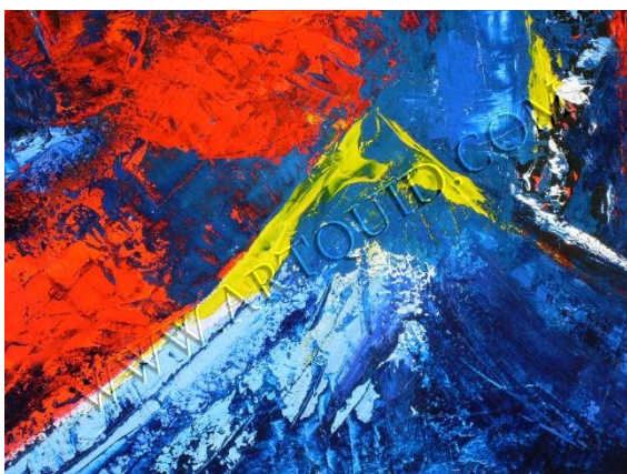
Ejemplo de pintura expresionista con los tres colores primarios.

Movimiento artístico y literario de origen europeo surgido a principios del siglo XX que se caracteriza por la intensidad de la expresión de los sentimientos y las sensaciones.