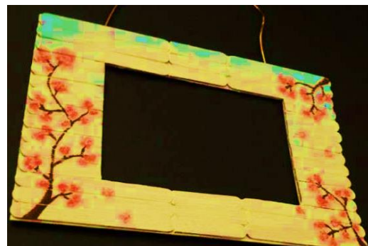
Palitos de helado