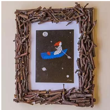
Ramitas de árbol

Aquí tienes algunas ideas de marcos para fotos con material reciclado.