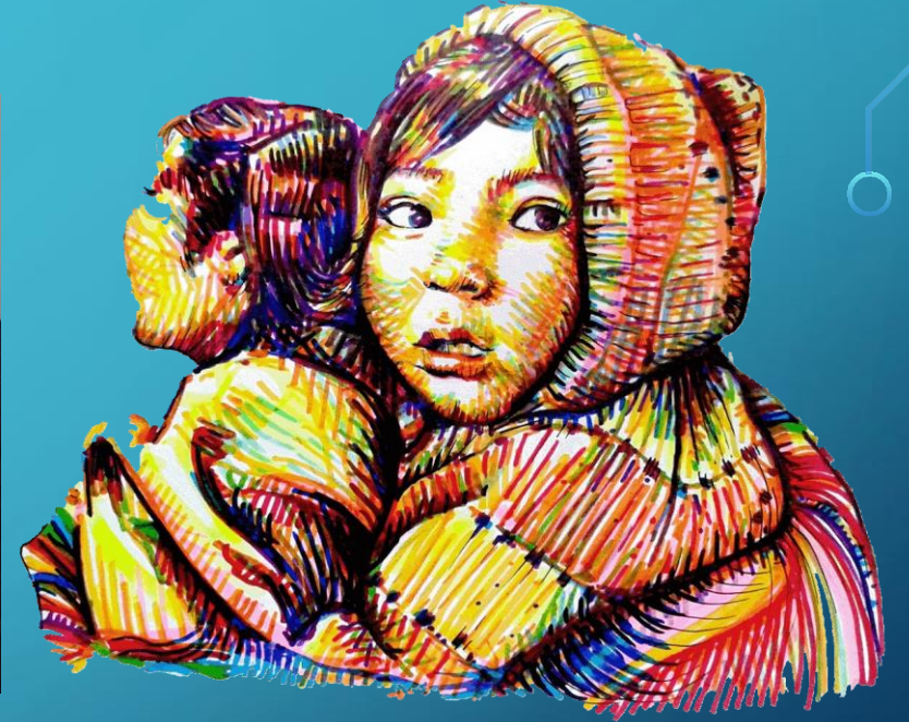
“Niña de Puno”, 2014 de Luna Calquin, dibujo a marcadores permanentes.