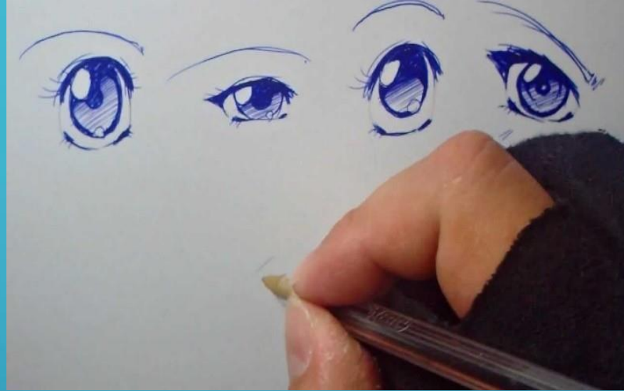
“Ojos de manga”, 2015 de Shukei, dibujo a lápiz pasta azul.