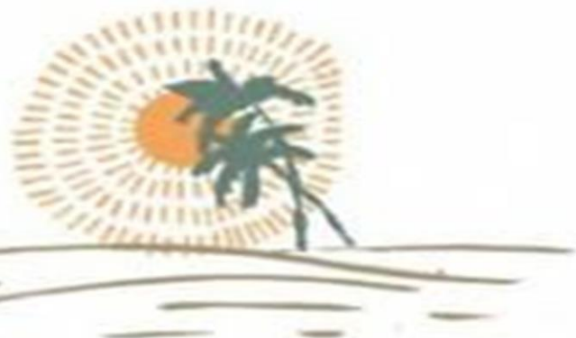
Hay lugares en el mundo donde hace mucho frío, otros donde el calor es sofocante