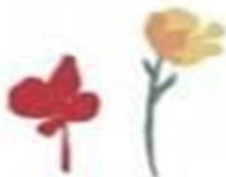
En las flores