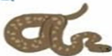
Unos vuelan, otros se arrastran por el suelo...