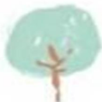
En los árboles