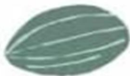
En las frutas