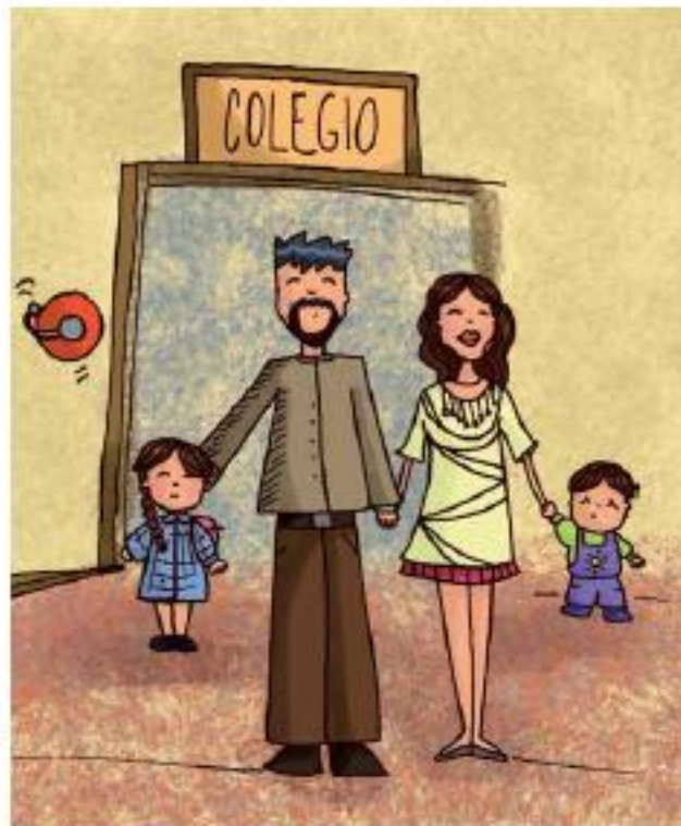
Marzo de este año.

Los acontecimientos en nuestra vida pueden ser este año, el que pasó o el próximo.