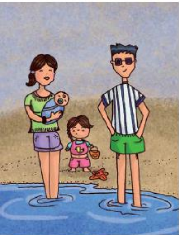
Febrero del año pasado.