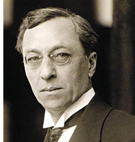
Vasili Kandinsky (1866- 1944)